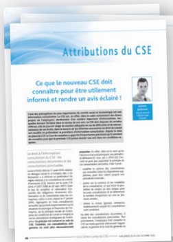
LAMY DU CSE